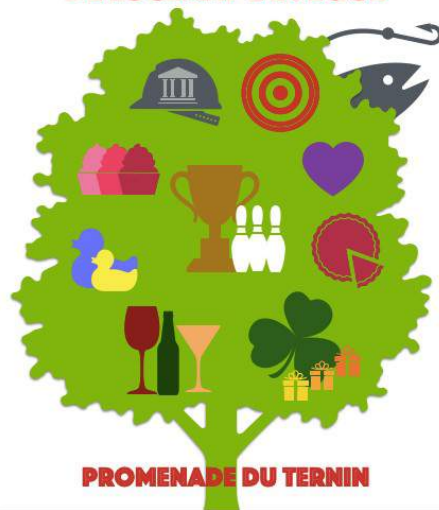
PROMENADE DU TERNIN

Le dimanche 1 er août 2021, toujours sur la promenade du Ternin, le Comité des Fêtes avaient mis quelques jambons à rôtir pour régaler pas moins de 100 participants contents de se retrouver pour passer cette journée ensemble.